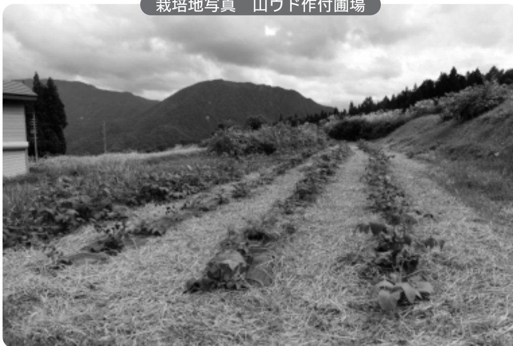
栽培地写真 山ウド作付圃場