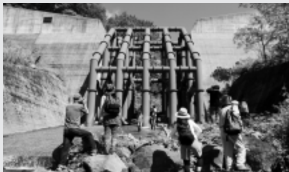
生木アート砂防ダム巡りツアー