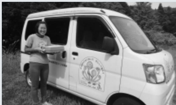
見守りを兼ねた配食サービス

急峻な地形に集落が点在し、冬は2mを越す積雪がある小谷村では、高齢化率が37%を越え、「最後まで安心してらせる村づくり」が急務となっています。高齢者の皆さんが健康で元気に暮らせるよう、社会福祉協議会を始め、村内事業者による高齢者等支援事業費に充当させていただきました。