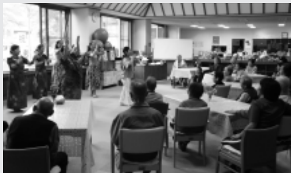
デイサービスの様子