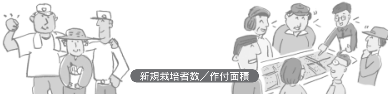
新規栽培者数／作付面積

新たな特産品開発を進めることと並行し、既存の特産品を守り、更に活かすことにより、地域6次産業化の推進を図ります。