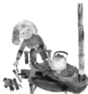
いわさきちひろ 『ストーブに薪をくべる少女』(1973年)