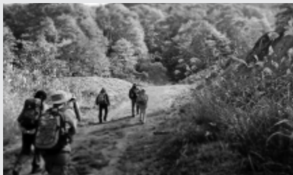
紅葉の塩の道ガイドツアー

四季折々の自然体験ができる小谷村。現地ツアー、観光施設整備、小谷村の魅力発信などの観光振興事業に充当させていただきました。