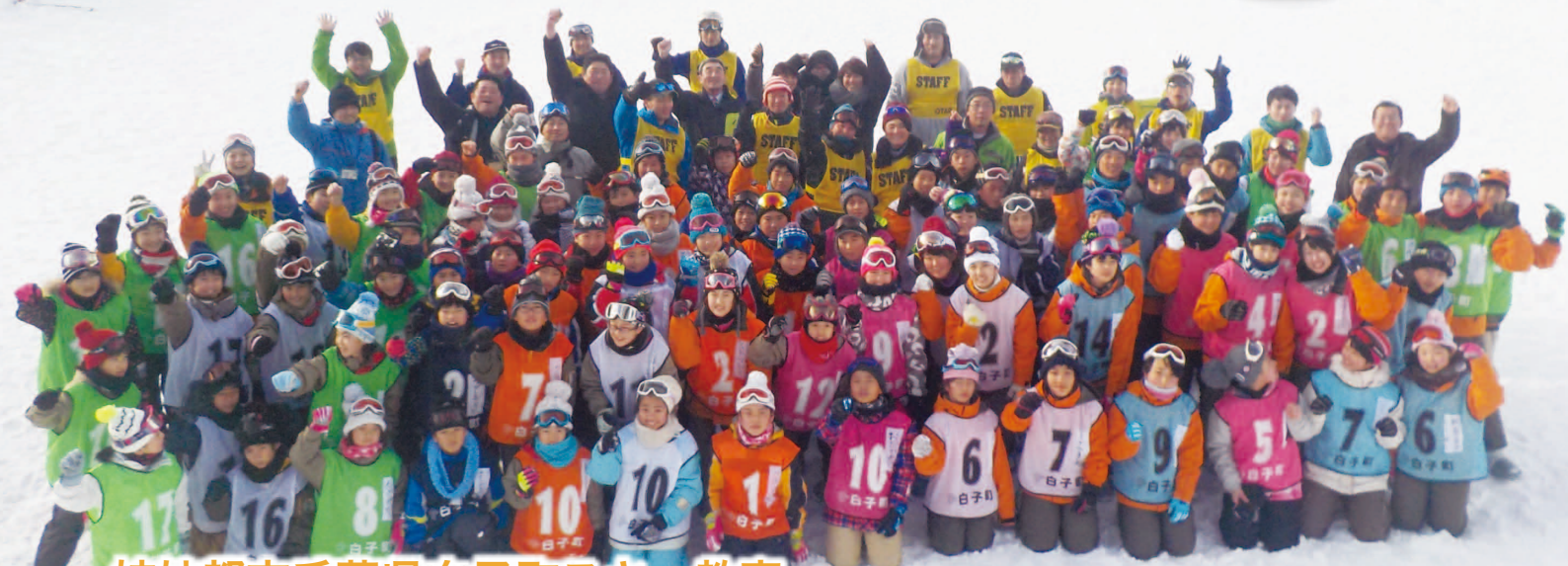
姉妹都市千葉県白子町スキー教室