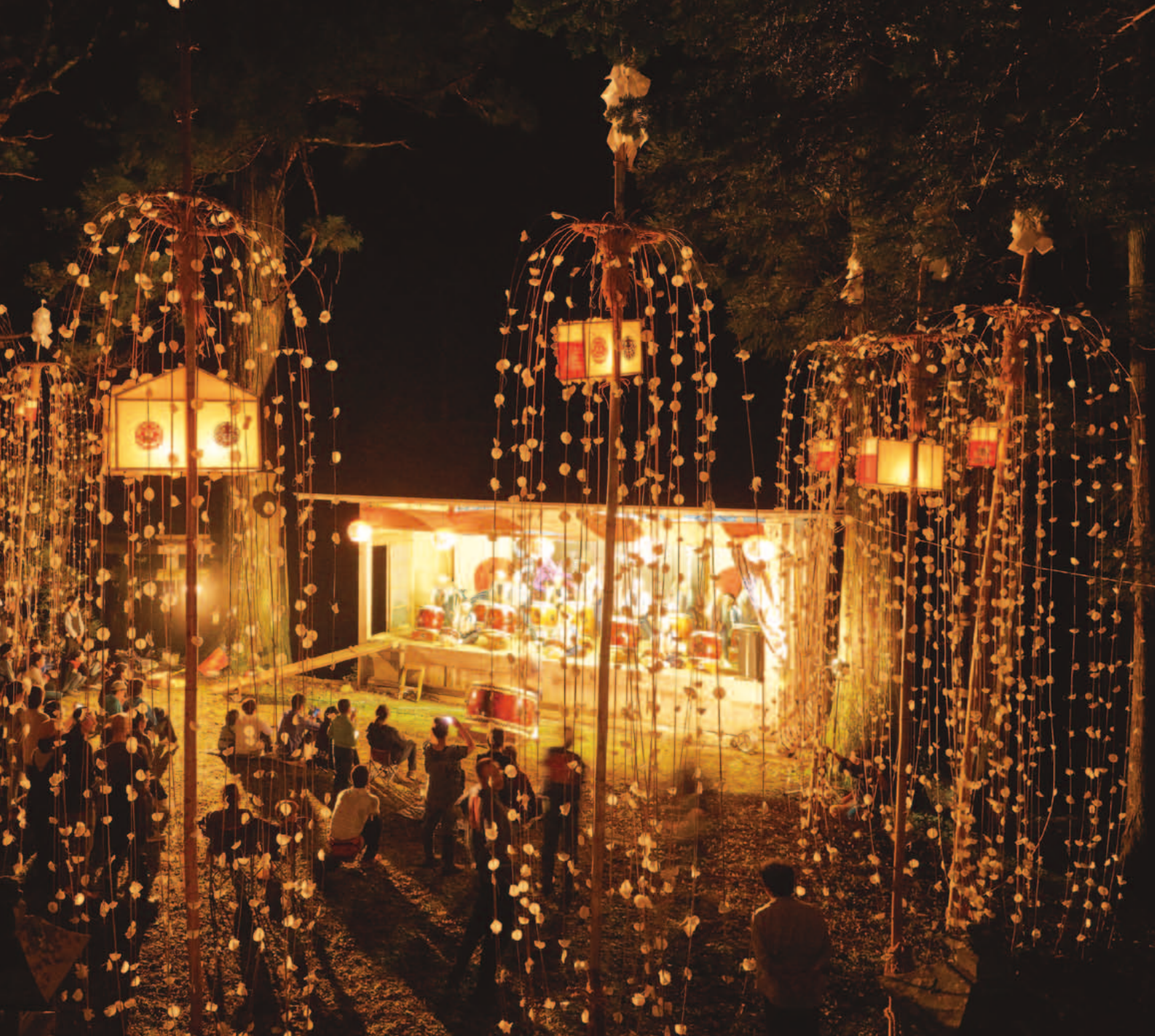
北小谷深原 宇宮諏訪神社 花灯籠 毎年第一土曜日