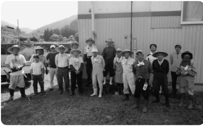
▲設置時には多くの住民の方が作業に参加した。