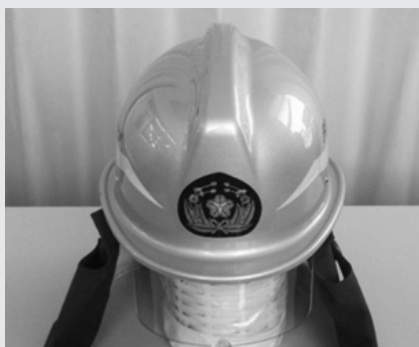
シコ口付き消防団用防火ヘルメット 10個