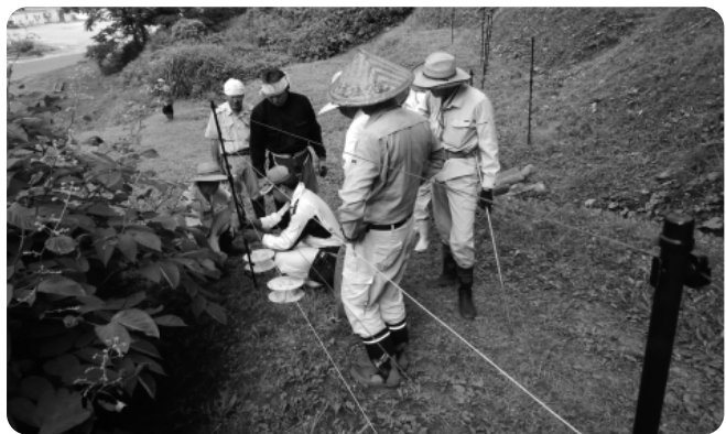
▲起伏が激しい箇所も杭の間隔を微調整し設置していく。

大きな労力を掛けて設置した為、住民の方の熱量も非常に高い。設置してから半月経った今も草刈などの管理を徹底されており非常に美しい一団の農地となっている。