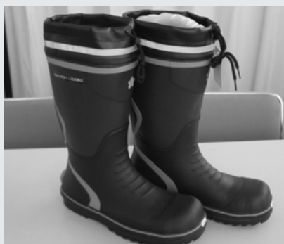
カバー付き消防団用安全長靴 200足