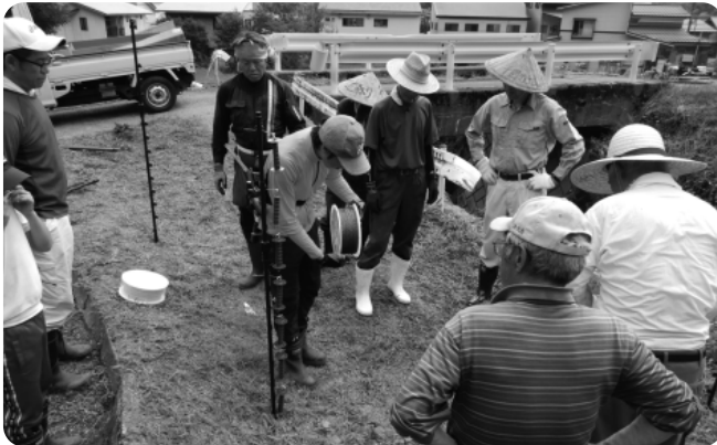
▲メーカーにより設置方法の説明を受けている。3班に分かれ、それぞれ作業を進めていく。

今まで電気柵を張った経験が無い方が大半を占める為、JAや電気柵メーカーによる設置方法の講習から始まった。設置には計4日が掛かった。また、冬には雪が積もるため、電気柵を撤去する予定。これだけの広範囲の撤去にも大きな負担が掛か