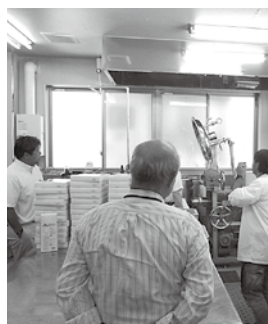
古美里設備整備を