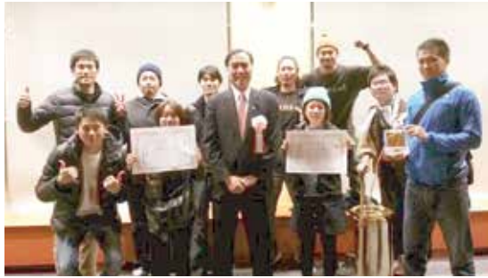
阿部知事とともに

便利になったこの世の中は、携帯電話を使い電話一本でなんでもでき、快適な生活空間が当たり前といえます。便利になっただにもかかわらず、昔に比べ身の回りが劇的に進化した様子はなく、時間の使い方は昔の人より下手なのかもしれません。そんな中でも昔から変わらないと思うのがこの環境でしょうか。なん