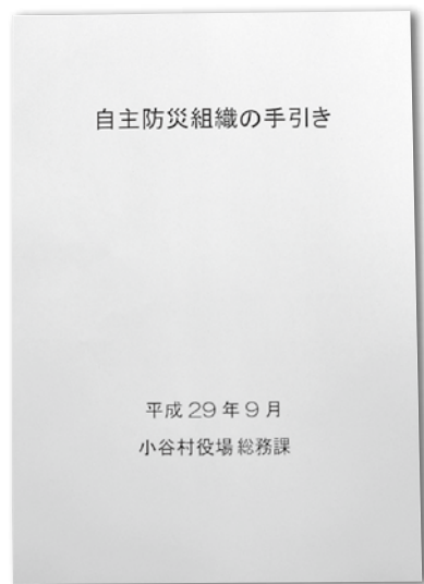
集落で参考に「自主防災組織の手引」

答 村長 「自主防災組織」の手引書を作成したので、各地区ごとに配布をし、村のホームページの防災ページにも公開する等、必要性を訴えていくことができる事なら、指定避難所単位で自主防災組織を立ち上げ、地域の語り合い事業を使って、ぜひ取り組みを