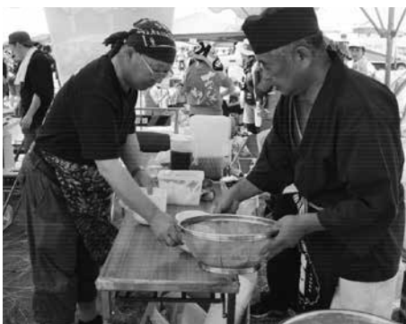
白子町でそば打ちをする伝承人と村長

小谷村として取り組むべき課題に優先順位を付け、小谷村としても、抜本的な対策を講じる必要性を申し上げ結びとした。