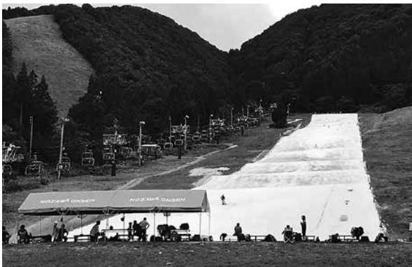
1年中滑りたいが…(野沢温泉村)

他村との施設の重複を防 ぐなど、広域的な整備が必 要で、なにより広域的な利 用を望むものである。