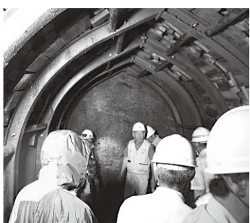
伊折水路トンネル工事中