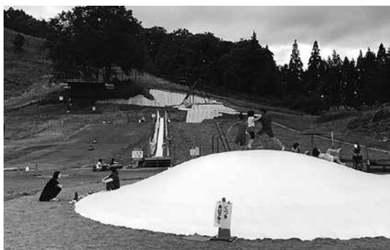
こんな公園 小谷にもほしい!

いずれにしても、地域で の話し合いを十分にしてい て、地域の話し合いに村がオ プザバー的に出ることも可 能であり、その時は相談い ただきたい。