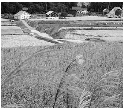
米作りの減少が心配