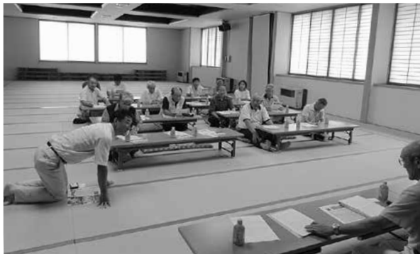
生産者が開田村へ研修