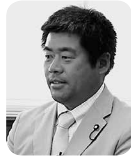
猪股 充拡 議員