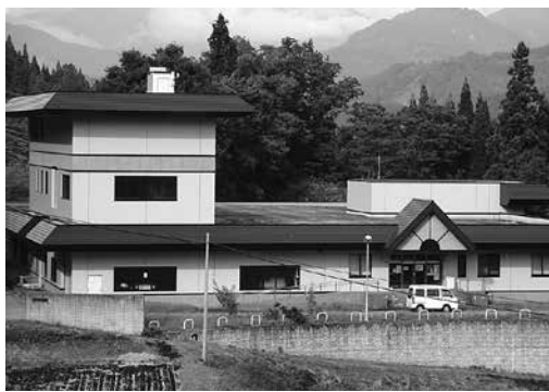
利用が検討される施設(白馬乗鞍浄化センター)