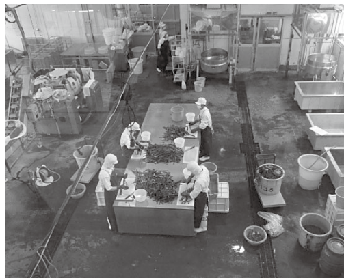
既存施設の再利用を検討

設の具体像により、現在の「古美里」が施設、または設備的に対応できるか。改修費用はどのくらい要するのか、また運営体制の在り方等、具体的な検討と必要に応じた調査を行いたいと考えている。