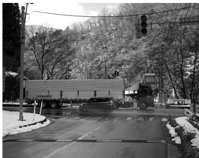
村民のみなさん注意して!!