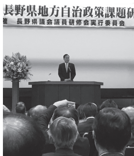
共通課題を認識し村政に生かします