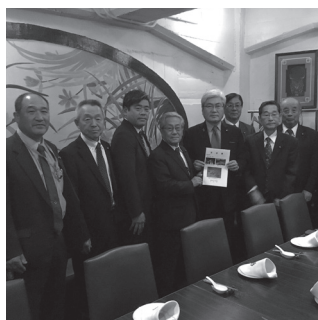
地元務台先生へしっかり小谷村の要望書を渡す