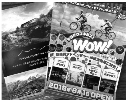
進化しつづける観光地

他の都道府県の様子を調べると、県単位で各市町村ごとに「交通事故発生マップ」や「交通安全ヒヤリ・ハット・マップ」などを作成し、広域的に事故防止に努めているケースが多々あり、県単位で作成することにより、効果が出るかと考えるので、関係機関に働きかけをしたいと思う。