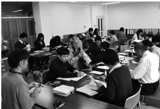
年末年始休みなく！ふるさと納税事務作業

村長 現在、チームラボセールズに協力してもらいながら、庁内若手職員を中心として係を横断的に跨いだ組織を編成している。若い世代を中心に、担当課とこの組織が連携して返礼品の検討などを考えている。