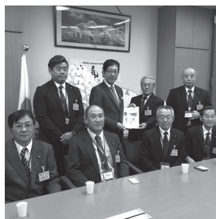
新潟6区高鳥先生へ松糸道路の要望