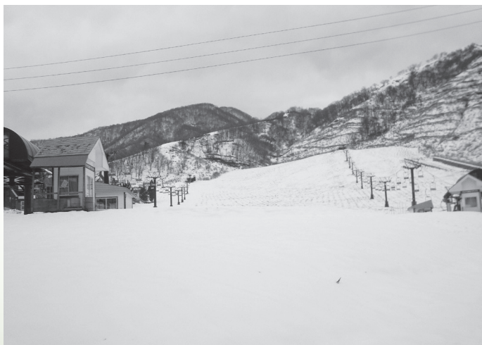
早急な観光再生が必要!!

夫を凝らすとともに、自覚 と誇りを持って住民のニー ズを先取りし、先導的役割 を果たしてゆく心意気で村 政発展の期待に応えていく ことを望み、相ともに心を 新たに「住み続けたい 村」「住んでみたい村」の ために、皆様とともに邁進 して参りたいと思えます で、多くの方のご支援、ご 協力を賜りますようお願い 申し上げます。