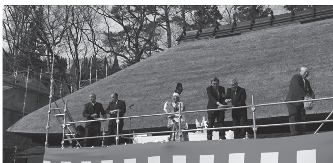
いつまでも守りたい歴史と伝統