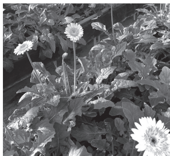
素敵なガーベラがいっぱい！！