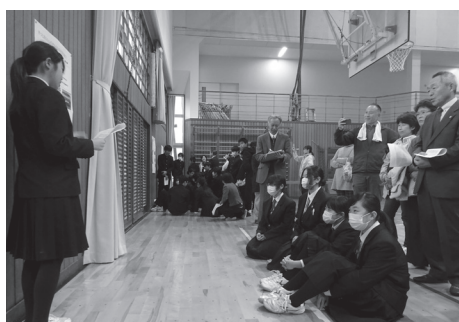
しっかりまとめられた素晴らしい報告会でした