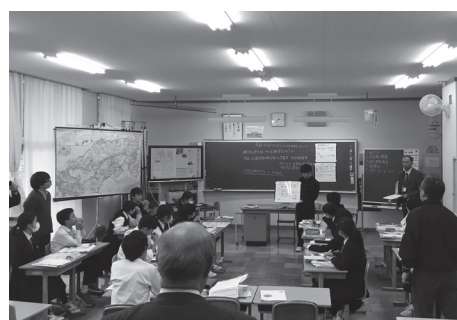
授業を聞きながら改めて初心にかえります