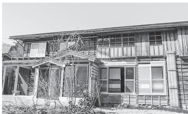
深原おためし住宅 外観