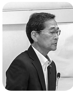
藤原 賢司 議員