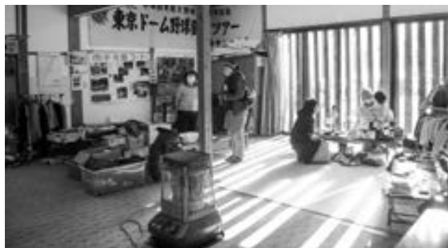
リサイクル活動中

小谷村第6次総合計画においては、本編第2章「計画の基本的事項」第2項にSDGsの17の目標と当計画の関連を整理している。当計画では、それぞれの施策項目がSDGsの掲げる目標の内、12の項目に寄与すると示している。中でもSDGsの目標11「包括的で安全かつ強靱（レジリエント）で持続可能な都市