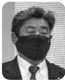
猪股 充拡 議員