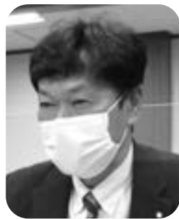
深澤 英喜 議員