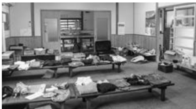
地域のリユース活動

当計画の各施策の実現がSDGsの目標達成に寄与するとの考えから、新たに組織される審議会においてSDGsへの関わりも踏まえ、進捗動向や改善点などを審議を進めて行きたいと考