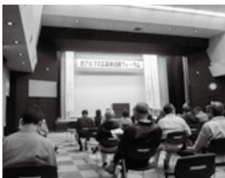
広葉樹活用フォーラム