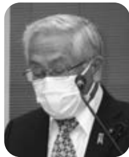
宮澤 正廣 議員