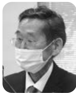
藤原 賢司 議員