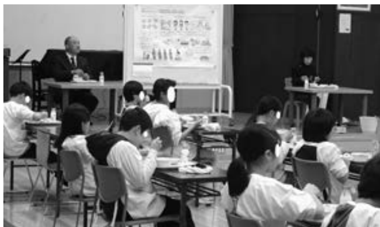
児童と給食を食べる会 (11/16)

問 「中心にランチルームがある学校」は小谷小の特色、食の学びを大切にしたいという村民