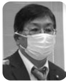
吉澤 学 議員