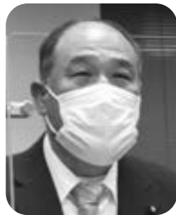
吉岡 久人 議員