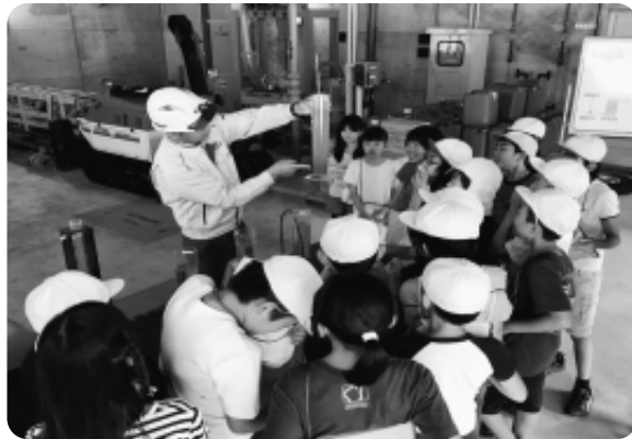
白馬乗鞍浄化センターの見学

そして、実際に処理槽を見学し、各家庭から流れてきた下水流入水が微生物により処理されて、さらにきれいな水に分離され、河川放流される様