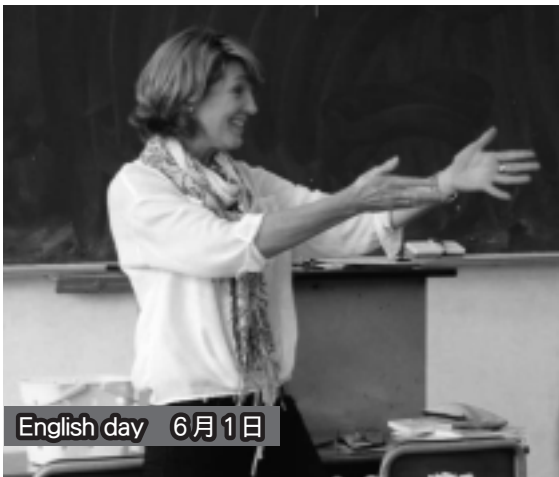
English day 6月1日