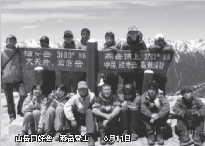
山岳同好会 燕岳登山 6月11日

http://www.nagano-c.ed.jp/hakubahs TEL 0261 (72) 2034 (代表)