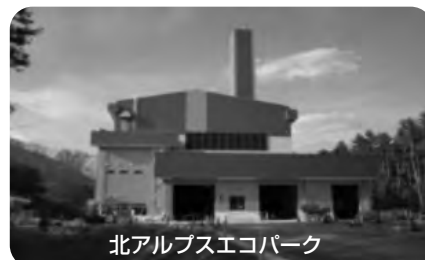
北アルプスエコパーク