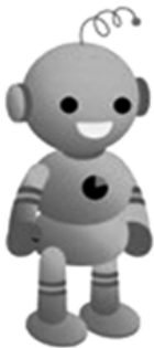
工業統計キャラクター・コウちゃん