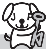
公的個人認証 サービスPRキャラクター マイキーくん