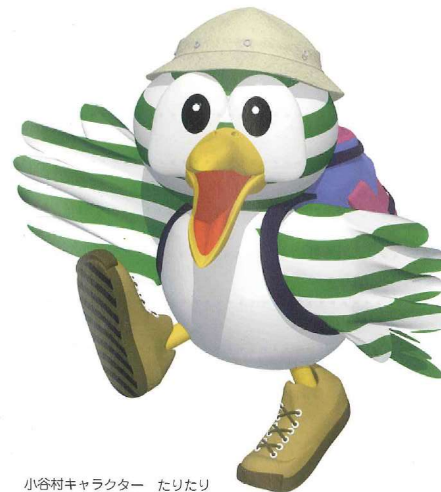
小谷村キャラクター たりたり

村民の皆さまひとりひとりが、 ごみの減量やリサイクルへ取り組むことで ごみは減らすことができ、貴重な資源の節約にもなって、 環境保全につながります。 ご協力をよろしくお願いいたします。